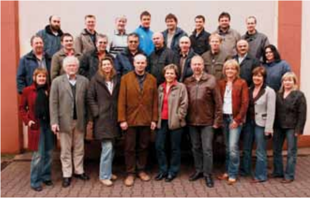
Partenstein / Lohr am Main